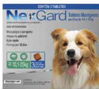
22088 NEXGARD 3 G/25KG 3GR C/3COMP.