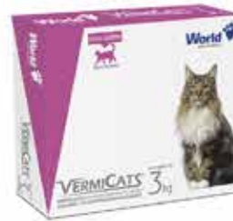
15964 VERMICATS 600MG (3KG) CARTUCHO C/ 4 COMP.