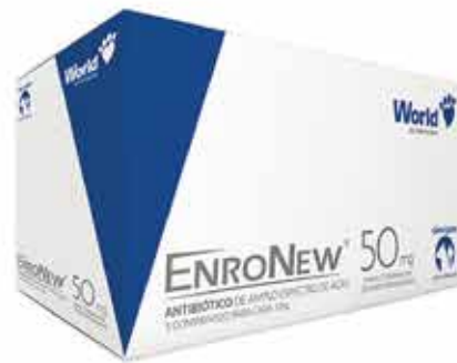
15970 ENRRONEW 50MG (10KG) DISPLAY 15CART 10 COMP.