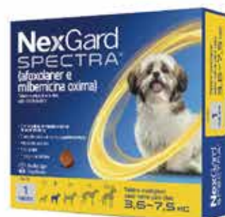
22085 NEXGARD SPECTRA 3 P/7,5KG 1GR C/3COMP.