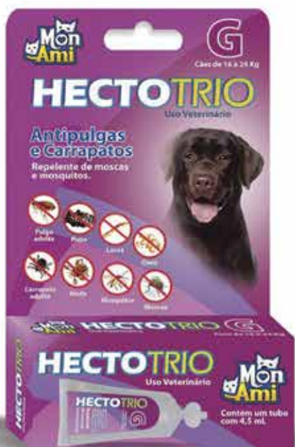
22419 HECTOTRIO CAES G 4,5 ML