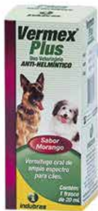
17388 VERMEX PLUS 20ML