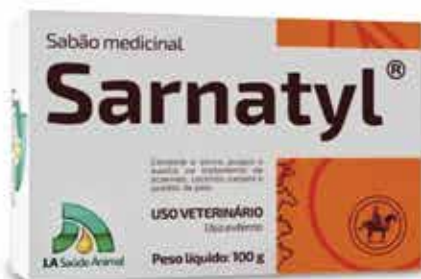
22057 SABAO SARNATYL 100 GRAMAS