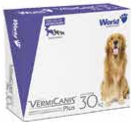
15959 VERMICANIS 2.4G (30KG) CARTUCHO C/2 COMP.