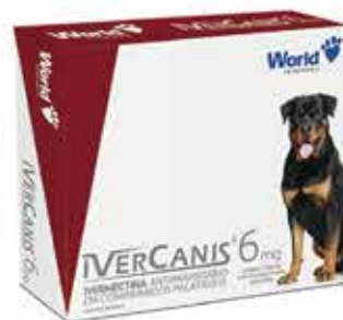
15952 IVERCANIS 6MG C/ 4 COMP. (30KG)