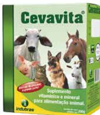
20299 CEVAVITA 200 GR.