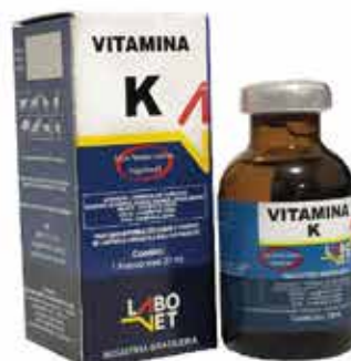
20308 VITAMINA K 20 ML