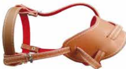
20589 FOCINHEIRA GLADIADOR AJUSTAVEL