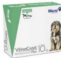
15958 VERMICANIS 800MG (10KG) CARTUCHO C/4 COMP.