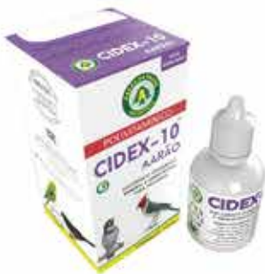
20624 CIDEX-10 POLIVIT. 10 ML