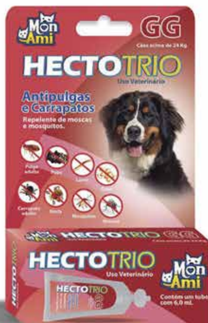
22420 HECTOTRIO CAES GG 6 ML