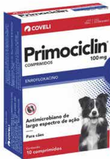
14361 PRIMOCICLIN 100 MG C/ 10 COMPRIMIDOS