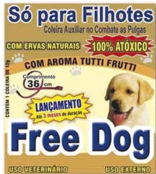
15748 COLEIRA FREE DOG FILHOTE PARA PULGAS 12G