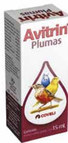
14470 AVITRIN PLUMAS 15ML