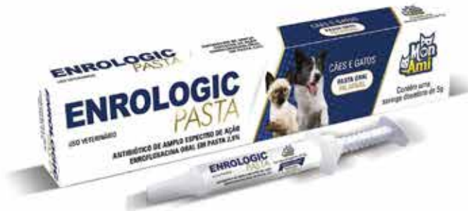
22409 ENROLOGIC PASTA 5GR