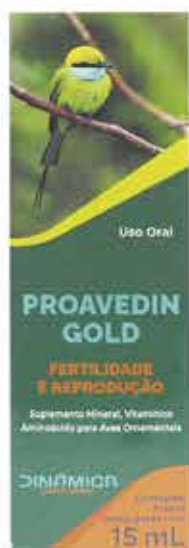
18427 PROAVEDIN GOLD FERTILIDADE E REPRODUÇÃO