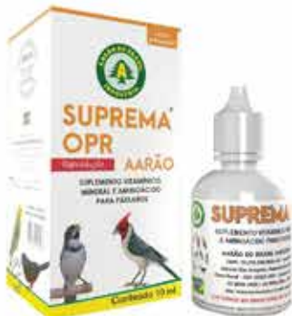
20625 SUPREMA OPR FRASCO 10ML