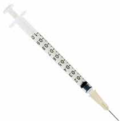
20449 SERINGA 1ML C/ AGULHA