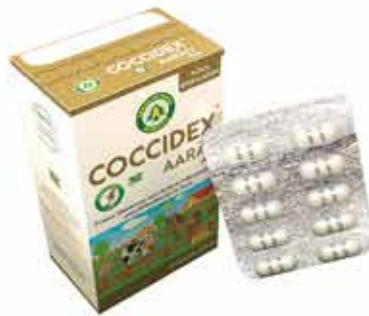
20587 COCCIDEX 30CPS - 130 MG