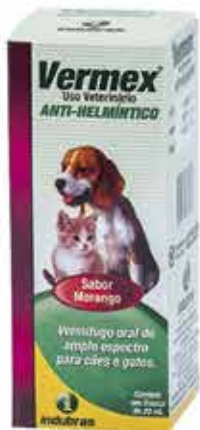
17387 VERMEX 20ML