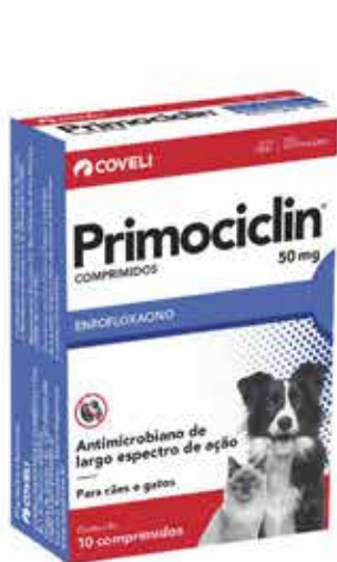
14360 PRIMOCICLIN 50 MG C/ 10 COMPRIMIDOS