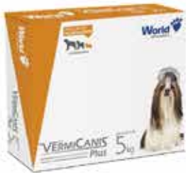
15957 VERMICANIS 400MG (5KG) CARTUCHO C/4 COMP.