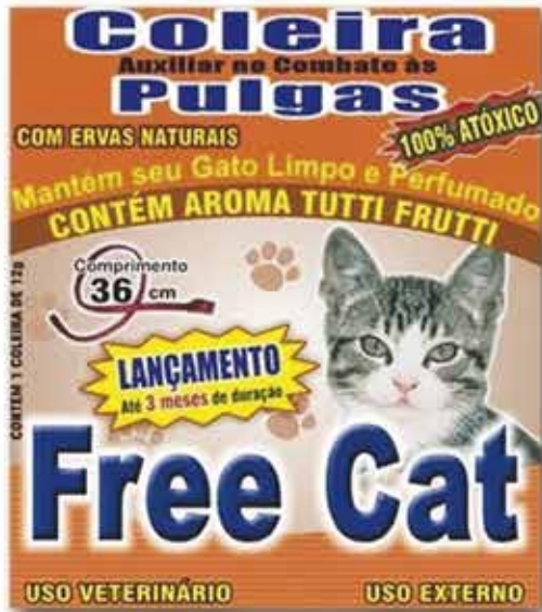
15750 COLEIRA FREE CAT PULGAS GATOS 12G