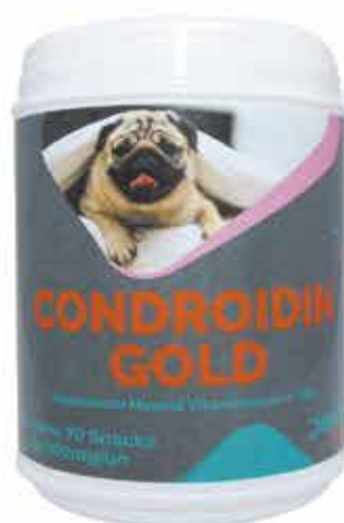
18437 CONDROIDIN GOLD C/ 70 SNACKS