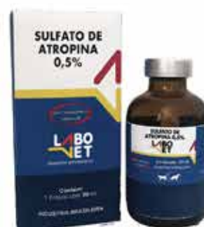
20303 SUIFATO DE ALTROPINA 0,5%