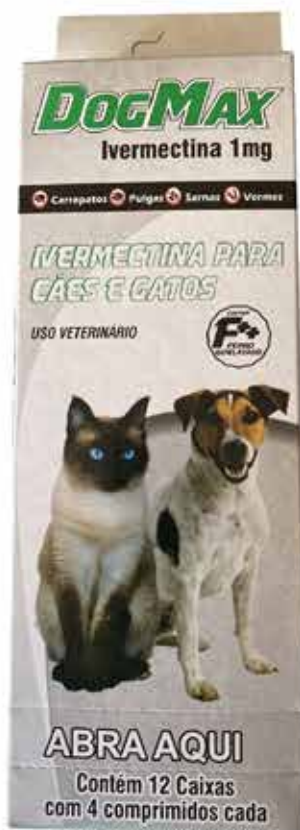
21071 DOG MAX IVERMECT. 1MG CAO E GATO