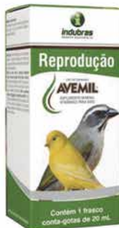
19505 AVEMIL REPROD. 20 ML