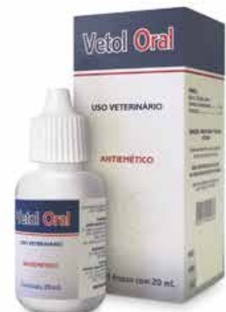
22059 VETOL ORAL 20 ML