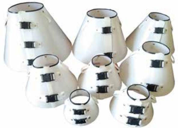
21408 COLAR PROTETOR ELIZABETANO N.03 C/6