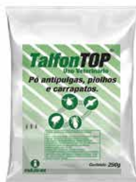
20289 TALFONTOP PO ANTIPULGAS E CARRAPATOS 250