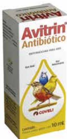
13432 AVITRIN ANTIBIOTICO PARA AVES 10ML