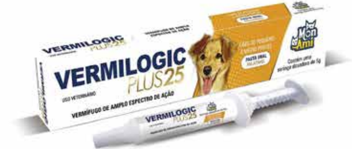
22411 VERMILOGIC PLUS 25