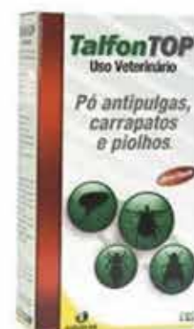
13736 TALFONTOP PO ANTIPULGAS E CARRAPATOS CX 100G