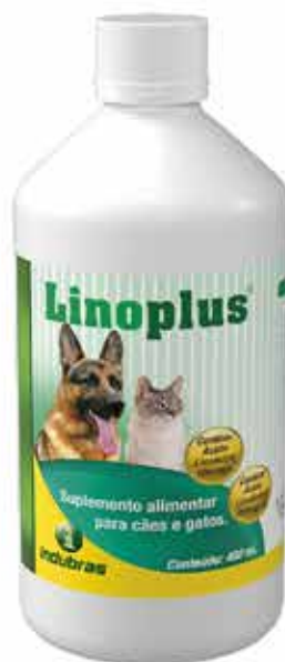
20298 LINOPLUS FRASCO 400 ML