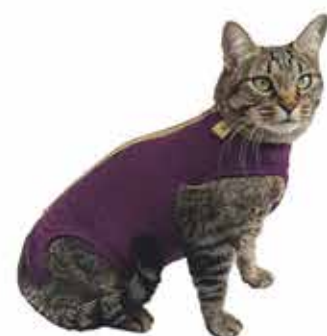
16444 ROUPA CIRURGICA DE GATO 1