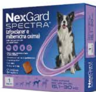
22083 NEXGARD SPECTRA 3 G/30KG 4GR C/3COMP.