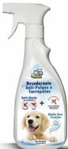
22414 DESOD. ANTI PULGAS/CARRAP. MON AMI 500ML