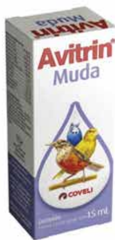
14354 AVITRIN MUDA 15ML