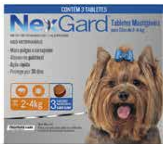
22090 NEXGARD 3 P/4KG 0,5GR C/3COMP.