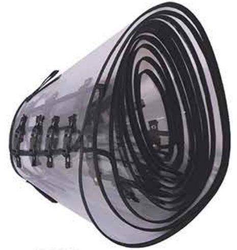
18565 COLAR PREMIUM 1 AO 10 COM PELÍCULA