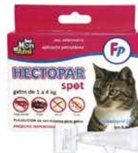
22416 HECTOPAR SPOT FP GATOS PIPETA 1 ML