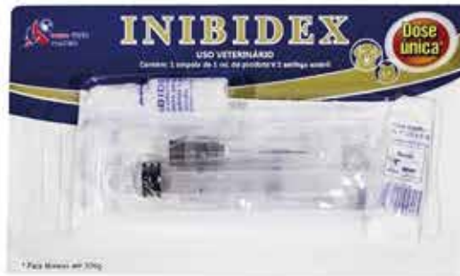
13670 INIBIDEX COM SERINGA 1ML