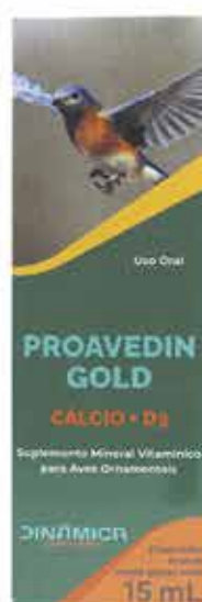
18428 PROAVEDIN GOLD CALCIO 15 ML