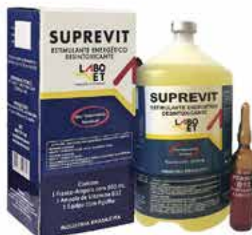
20304 SUPREVIT SORO 500 ML