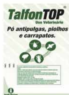
20301 TALFONTOP PO ANTIP/ CARRAPATO SACHE 100G