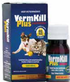
20311 VERMILL PLUS SUSPENSÃO 20 ML