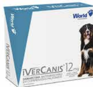
15953 IVERCANIS 12MG C/ 4 COMP. (60KG)