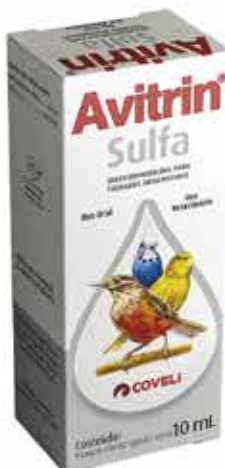
14476 AVITRIN SULFA 10ML