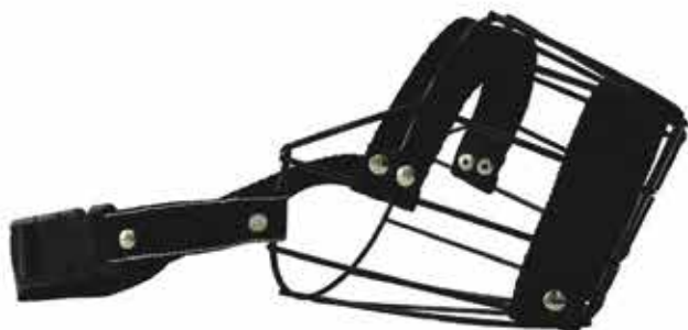
14800 FOCINHEIRA DE METAL N°01