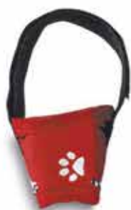
17708 FOCINHEIRA CONFORT N°01