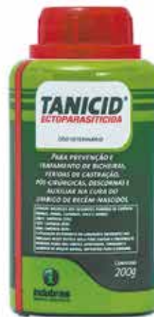
17386 TANICID TUBO 200G