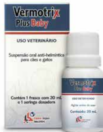
22058 VERMOTRIX PLUS BABY