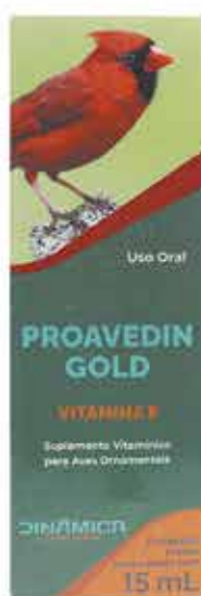
18432 PROAVEDIN GOLD VITAMINA E 15 ML