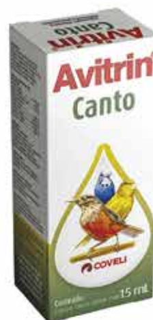
16243 AVITRIN CANTO 15ML