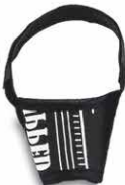
17710 FOCINHEIRA CONFORT N°03