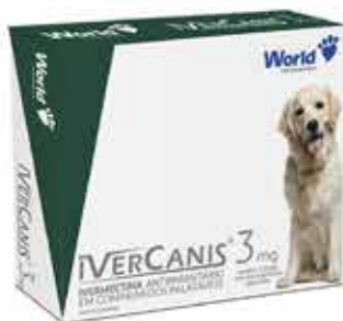
14585 IVERCANIS 3MG C/ 4 COMP. (15KG)