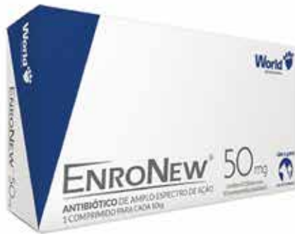
15956 ENRRONEW 50MG(10KG) CARTUCHO C/10 COMP.