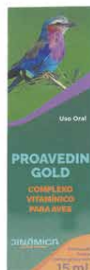
18429 PROAVEDIN GOLD COMPLEXO VITAMINICO 15 ML