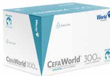
20920 CEFAWORLD 300MG CARTUCHO C/ 12 COMP