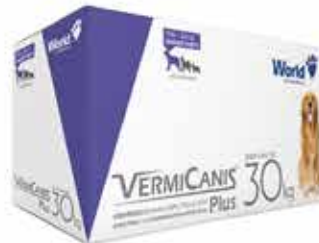
15960 VERMICANIS 2.4G(30KG) DISPLAY 10CART 2COM