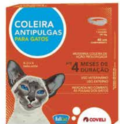
13430 COLEIRA ANTIPULGAS E CARRAPATOS BULLCAT