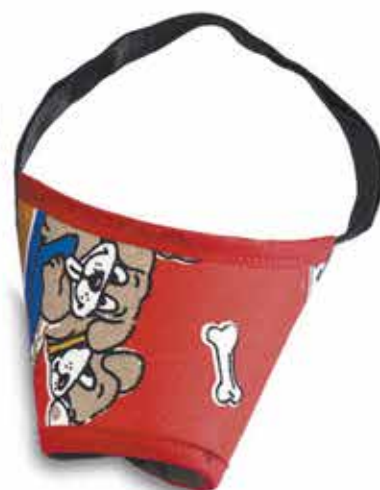
17712 FOCINHEIRA CONFORT N°05