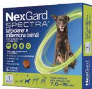
22084 NEXGARD SPECTRA 3 M/15KG 2GR C/3COMP.