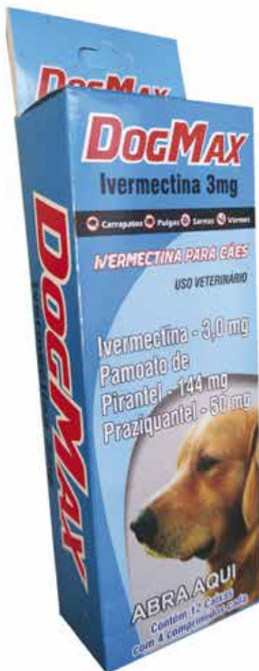
19181 DOG MAX IVERMECTINA 3% C/ 4 COMPRIMIDOS