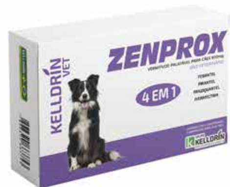
17306 ZENPROX CÃES MED. PORTE COM 4 COMPR. 900MG