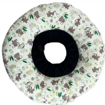
22495 COLAR CONFORT RECUPERAÇÃO P/ GATOS - P