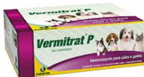
20294 VERMITRAT P DISPLAY /25