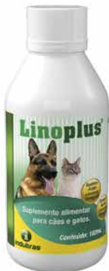
20297 LINOPLUS FRASCO 180 ML