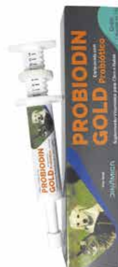
18433 PROBIODIN GOLD BISNAGA 14 G