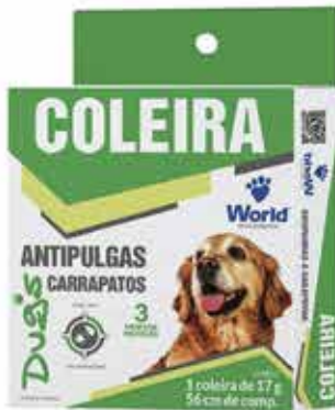
15966 DUG'S COLEIRA ANTIP. E CARRAP. 25GR.