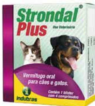
20293 STRONDAL PLUS C/4 COMPRIMIDO