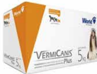
15962 VERMICANIS 400MG (5KG) DISPLAY 10CART 4 COMP.