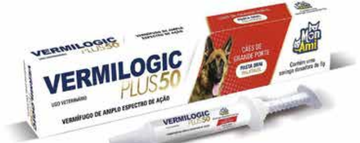
22412 VERMILOGIC PLUS 50