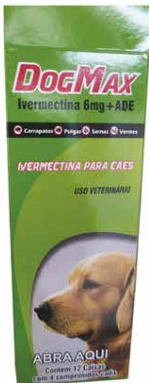
19182 DOG MAX IVERMECTINA 6% C/ 4 COMPRIMIDOS