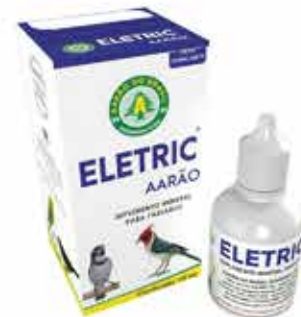
20623 ELETRIC FRASCO 10 ML