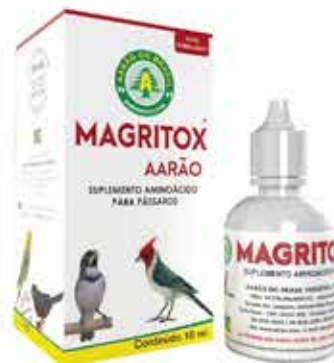
20622 MAGRITOX FRASCO 10ML