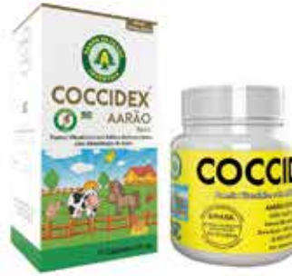
20586 COCCIDEX 75 CPS - 130 MG