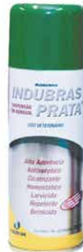
17389 MATA BICHEIRA IND. PRATA 200ML