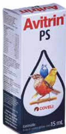
20923 AVITRIN PS 15ML