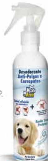
22415 DESOD. ANTI PULGAS/CARRAP. MON AMI 200ML