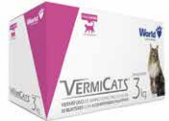
15963 VERMICATS 600MG (3KG) DISPLAY 10CART 4 COMP.