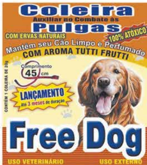
15751 COLEIRA FREE DOG PULGAS ADULTO CAES 20G