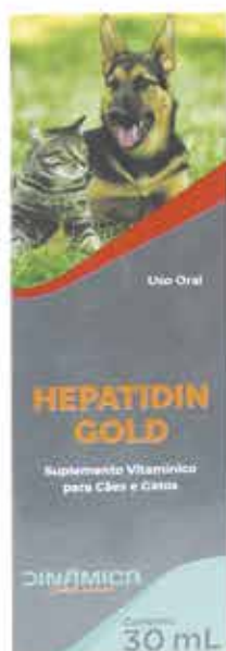
18434 HEPATIDIN GOLD 30 ML