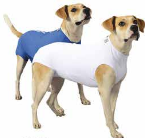
16420 ROUPA CIRURGICA MACHO 0