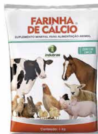
20300 FARINHA DE CALCIO PACOTE 1KG