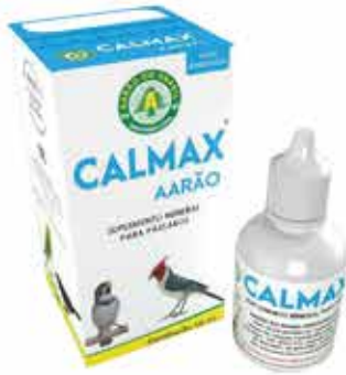
20621 CALMAX LIQUIDO FRASCO 10 ML