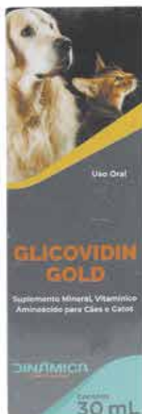
18436 GLICOVIDIN GOLD 30 ML