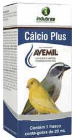
19501 AVEMIL CÁLCIO PLUS 20 ML