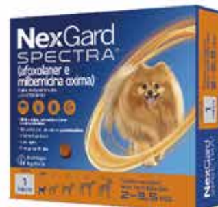
22086 NEXGARD SPECTRA 3 PP/3,5KG 0,5G C/3COM