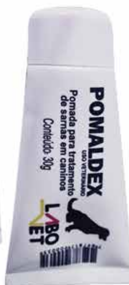
20309 POMALDEX POMADA SARNICIDA P/ CAES 30G