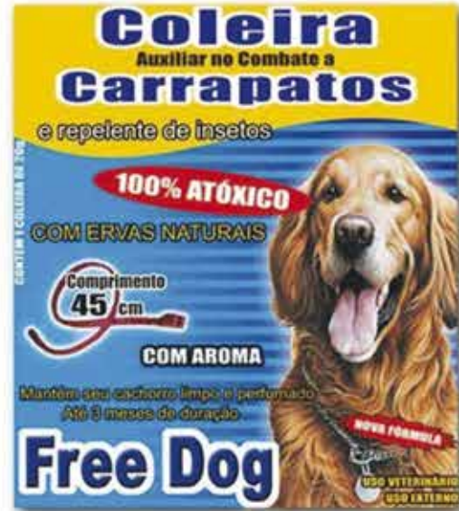
15749 COLEIRA FREE DOG CARRAPATO 20G