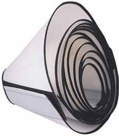
18564 COLAR VELCRO 1 AO 5