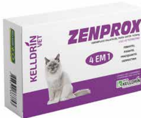
17309 ZENPROX GATO C/4 COMPR. 100MG