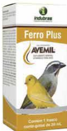
19502 AVEMIL FERRO 20 ML