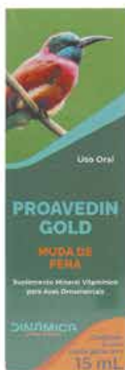
18431 PROAVEDIN GOLD MUDA DE PENA 15 ML