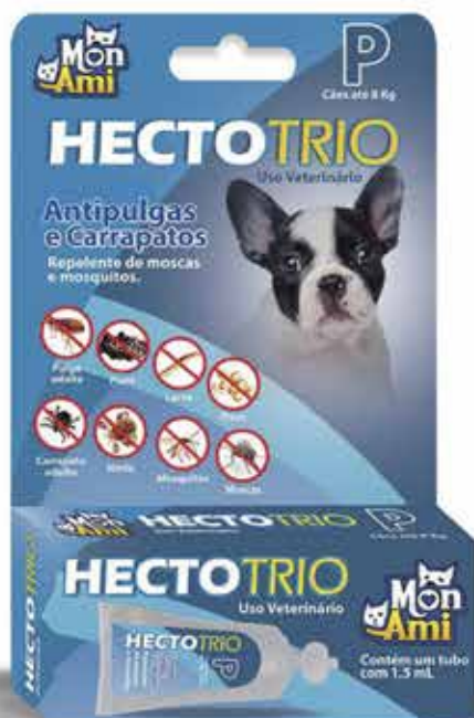
22417 HECTOTRIO CAES P 1,5 ML