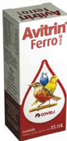
14469 AVITRIN FERRO MAX 15ML