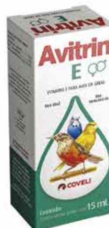
14155 AVITRIN VITAMINA E 15ML