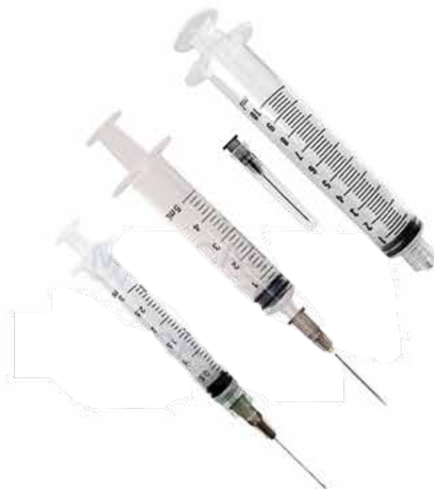
20446 SERINGA 3ML C/ AGULHA