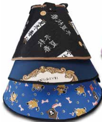
17729 COLAR ELIZABETANO CONFORT N°01