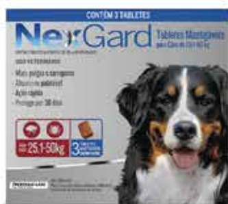
22087 NEXGARD 3 GG/50KG 6GR C/3COMP.