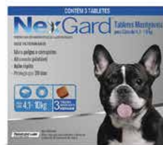
22089 NEXGARD 3 M/10KG 1,25GR C/3COMP.