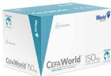
20918 CEFAWORLD 150MG CARTUCHO C/ 12 COMP