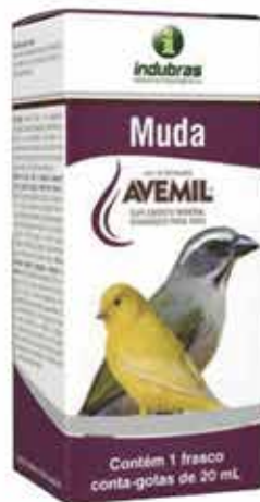
19503 AVEMIL MUDA 20 ML