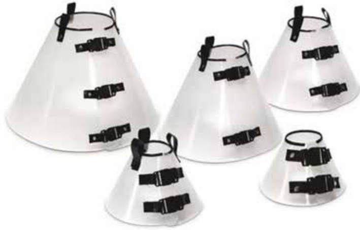
16162 COLAR PROTETOR ELIZABETANO JOGO N.01 À N.05