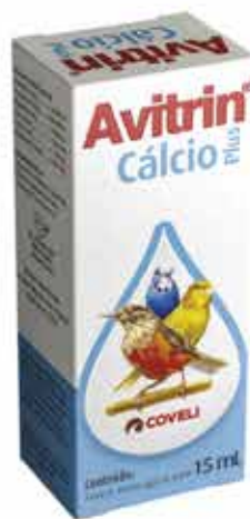
14156 AVITRIN CALCIO 15ML