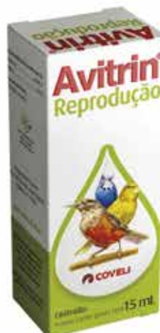
14353 AVITRIN REPROD. 15ML