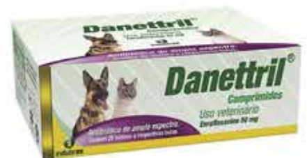
21460 DANETRIL BLISTER C/10 COMPRIMIDOS