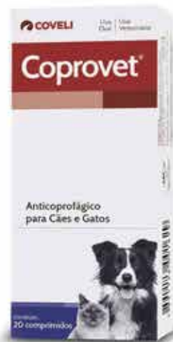
13433 COPROVET 500MG C/ 20 COMPRIMIDOS