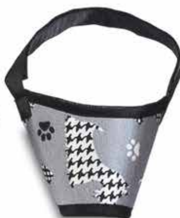
17711 FOCINHEIRA CONFORT N°04