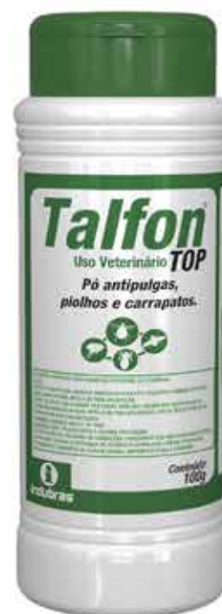
20291 TALFONTOP PO TALQUEIRA 100GR