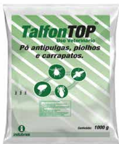
20290 TALFONTOP PO ANTIPULGAS E CARRAPATOS 1KG