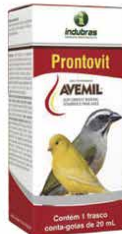
19514 AVEMIL PRONTOVIT 20 ML