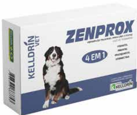
17308 ZENPROX CÃES GR. PORTE COM 2 COMPR. 2700MG