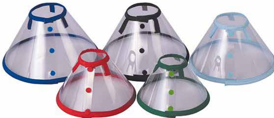
18566 COLAR COLORIDO PP AO GG