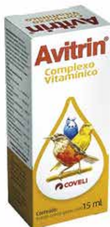
13431 AVITRIN COMPLEXO VITAMI. P/ AVES 15ML