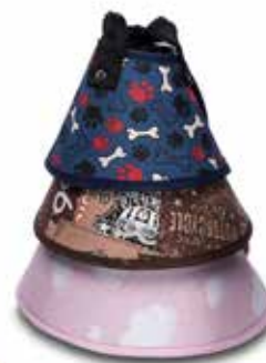
17731 COLAR ELIZABETANO CONFORT N°05