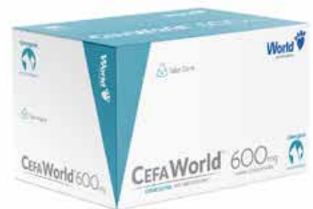
20921 CEFAWORLD 600MG CARTUCHO C/ 12 COMP