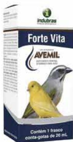
19513 AVEMIL FORTE VITA 20 ML