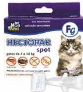
22410 HECTOPAR SPOT FP GATOS PIPETA 0,4 ML