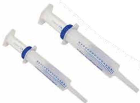
15270 SERINGA PLÁSTICA P - 5 ML