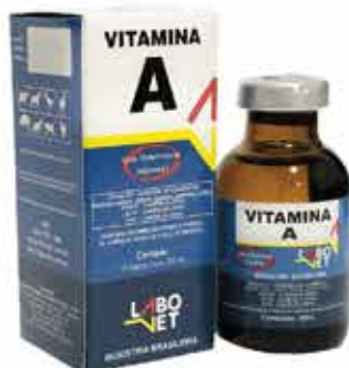
20305 VITAMINA A 20 ML