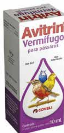
14157 AVITRIN VERMIFUGO 10ML