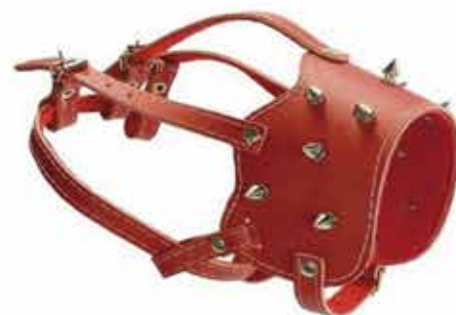
20590 FOCINHEIRA COM CRAVOS