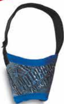
17709 FOCINHEIRA CONFORT N°02