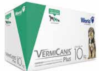
15961 VERMICANIS 800MG (10KG) DISPLAY 10CART 4 COMP.