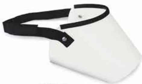
10756 FOCINHEIRA POLIPROP. JOGO N.01 À N.05