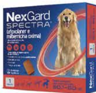
22082 NEXGARD SPECTRA 3 GG/60KG 8GR C/3 COMP.