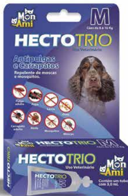
22418 HECTOTRIO CAES M 3 ML