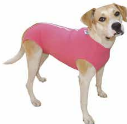
16433 ROUPA CIRURGICA FEMÉA 0