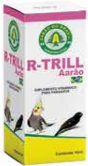
20620 R-TRILL LIQUIDO FRASCO 10 ML