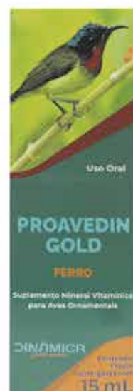
18430 PROAVEDIN GOLD FERRO 15 ML