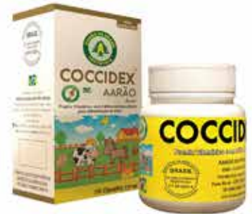
20585 COCCIDEX 150 CPS - 130 MG