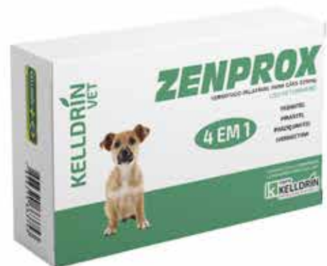
17307 ZENPROX CÃES PEQ. PORTE C/ 4 COMPR. 225MG