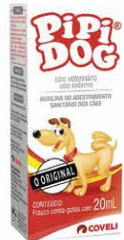
14356 PIPI DOG COVELI 20ML