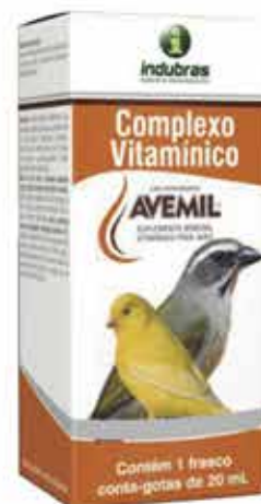
19504 AVEMIL COMPLEXO VIT. 20 ML