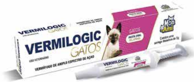
22413 VERMILOGIC GATOS 5 GR