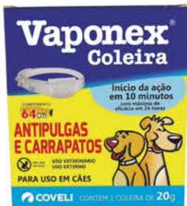
13428 COLEIRA ANTIPULGAS E CARRAPATOS VAPONEX