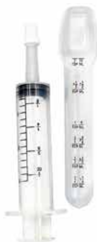
18206 DOSADOR DE REMÉDIO