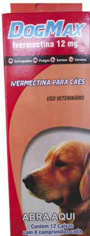
19183 DOG MAX IVERMECTINA 12% C/ 4 COMPRIMIDOS