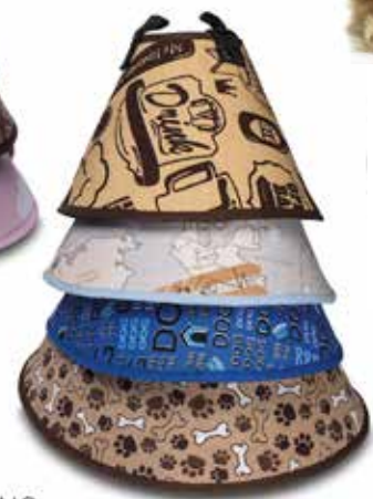
17732 COLAR ELIZABETANO CONFORT N°07