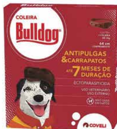
13429 COLEIRA ANTIPULGAS E CARRAPATOS BULLDOG