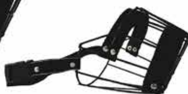
12423 FOCINHEIRA DE METAL N°05